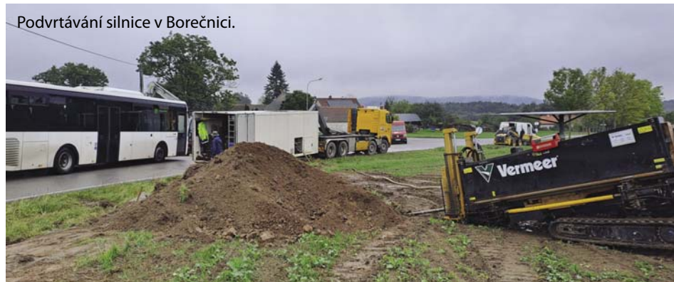
Podvrtávání silnice v Borečnici.

Na obou hřbitovech, na kterých je obec správcem pohřebiště, jsou nově umístěné stojany s konvemi a úklidovými pomůckami pro úklid hrobů. Konve i nářadí lze zapůjčit po vložení desetikoruny, která po vrácení nářadí vypadne