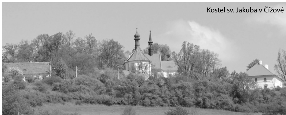
Kostel sv. Jakuba v Čížové

Zápisy jsou vždy vyvěšeny na obecních vývěskách, jsou k dispozici na obecním úřadě a na internetových stránkách obce www.cizova.cz .