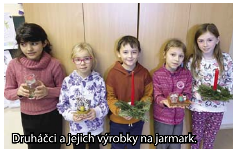
Druháci a jejich výrobky na jarmark.

Na jarmark jsme se snažili, aby výrobky byly skutečně vánoční. Začali jsme vyrábět zvonečkové rolničkami z malých květináčků. Zvonečky jsme natírali zlatou akrylovou barvou a přivázali jsme stužku. Dále jsme zlaté květináčky plnili posněženými šiškami a zlatými oříšky.