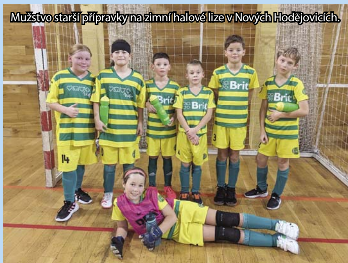
Mužstvo starší přípravy na zimní halové lize v Nových Hodějovicích.