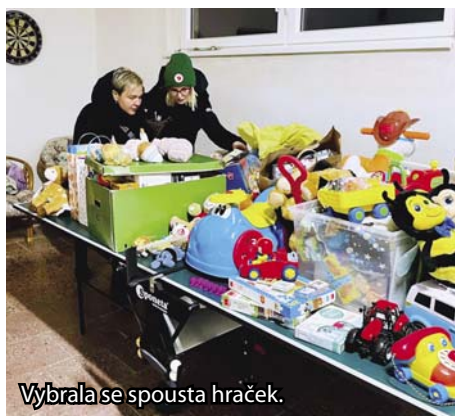
Vybrala se spousta hraček.