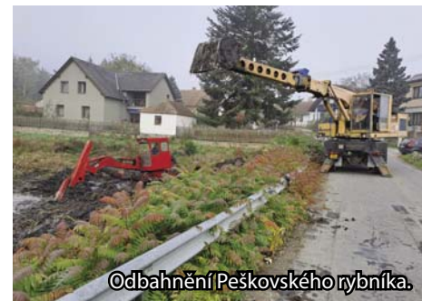
Odbahnění Peškovského rybníka.