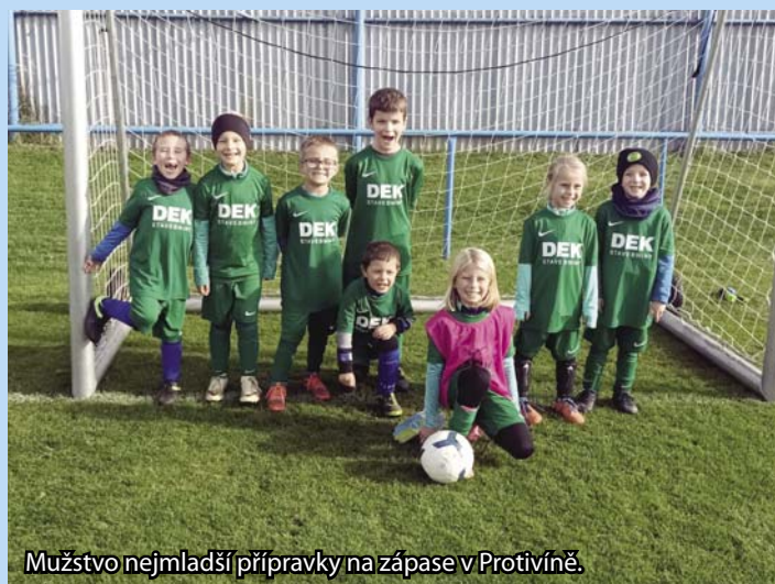
Mužstvo nejmladší přípravy na zápase v Protivíně.