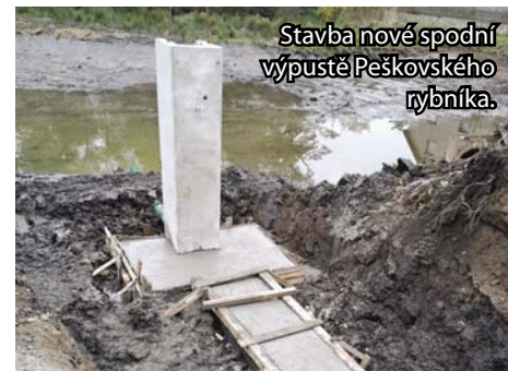
Stavba nové spodní výpustě Peškovského rybníka.