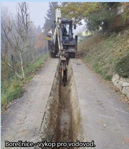
Borečnice - výkop pro vodovod.