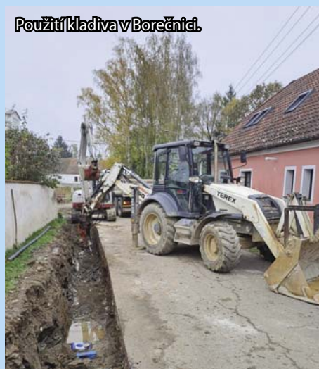
Použití kladiva v Borečnici.