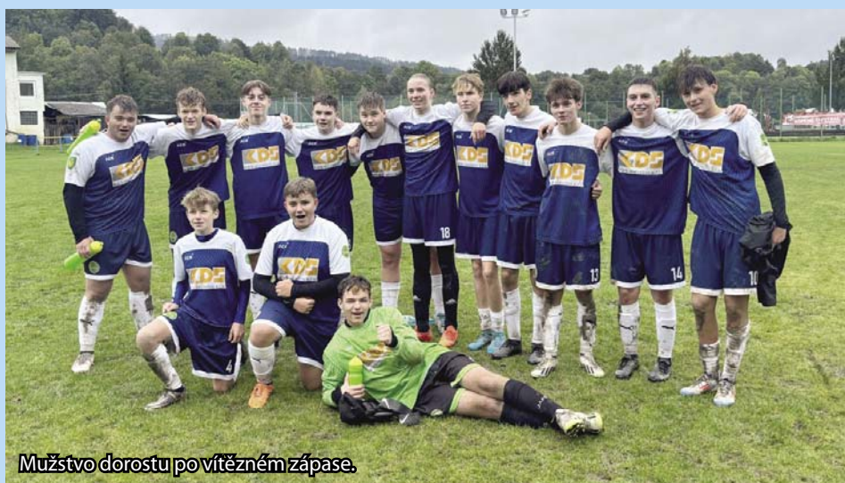
Mužstvo dorostu po vítězném zápase.