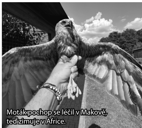
Moták pochop se léčil v Makově, teď zimuje v Africe.