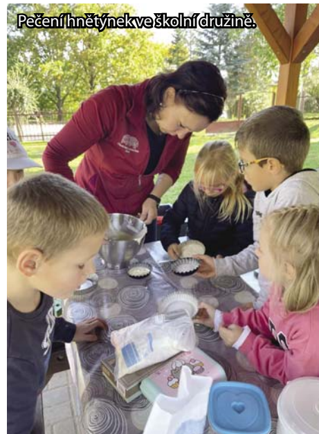
Pečení hnětýnek ve školní družině.