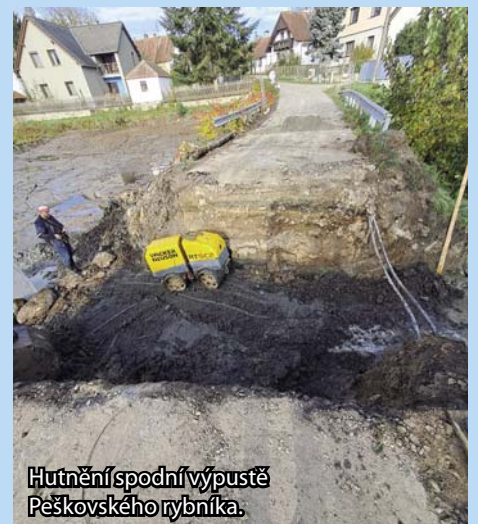
Hutněňí spodní výpustě Peškovského rybníka.