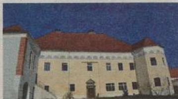
Nová fasáda zámku v Čížové