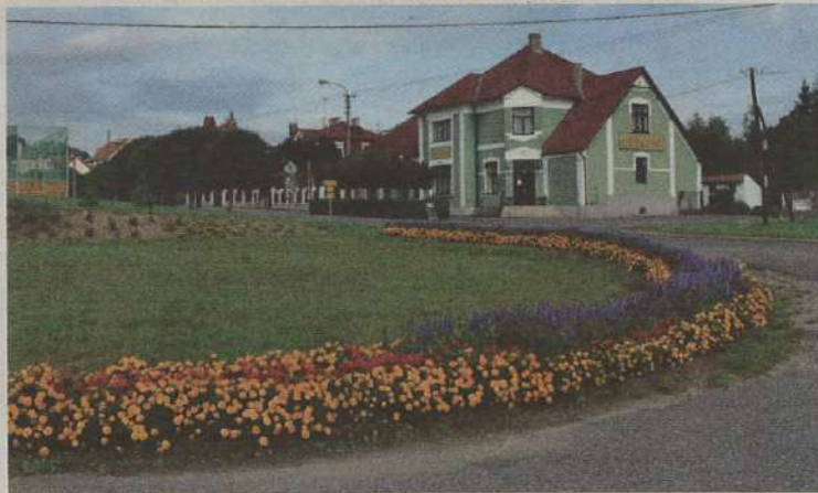
Příjezd do Čížové

V roce 1741 se před Čížovou strhla jedna z menších bitev o dědictví rakouské, v následujícím roce došlo u Červené hajnice k zavraždění tří francouzských „princezen“.