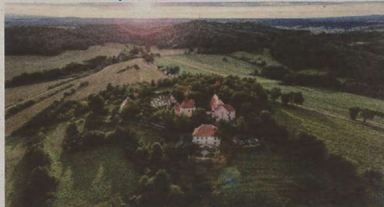
Sakrální stavby na Čížovské hoře

Obec byla vyhlášena Vesnicí roku Jihočeského kraje 2010.