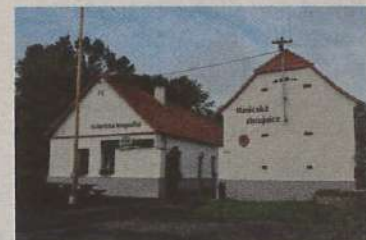
Obecní hospůdka v Bošovicích