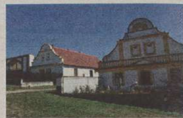
Krašovice selské baroko