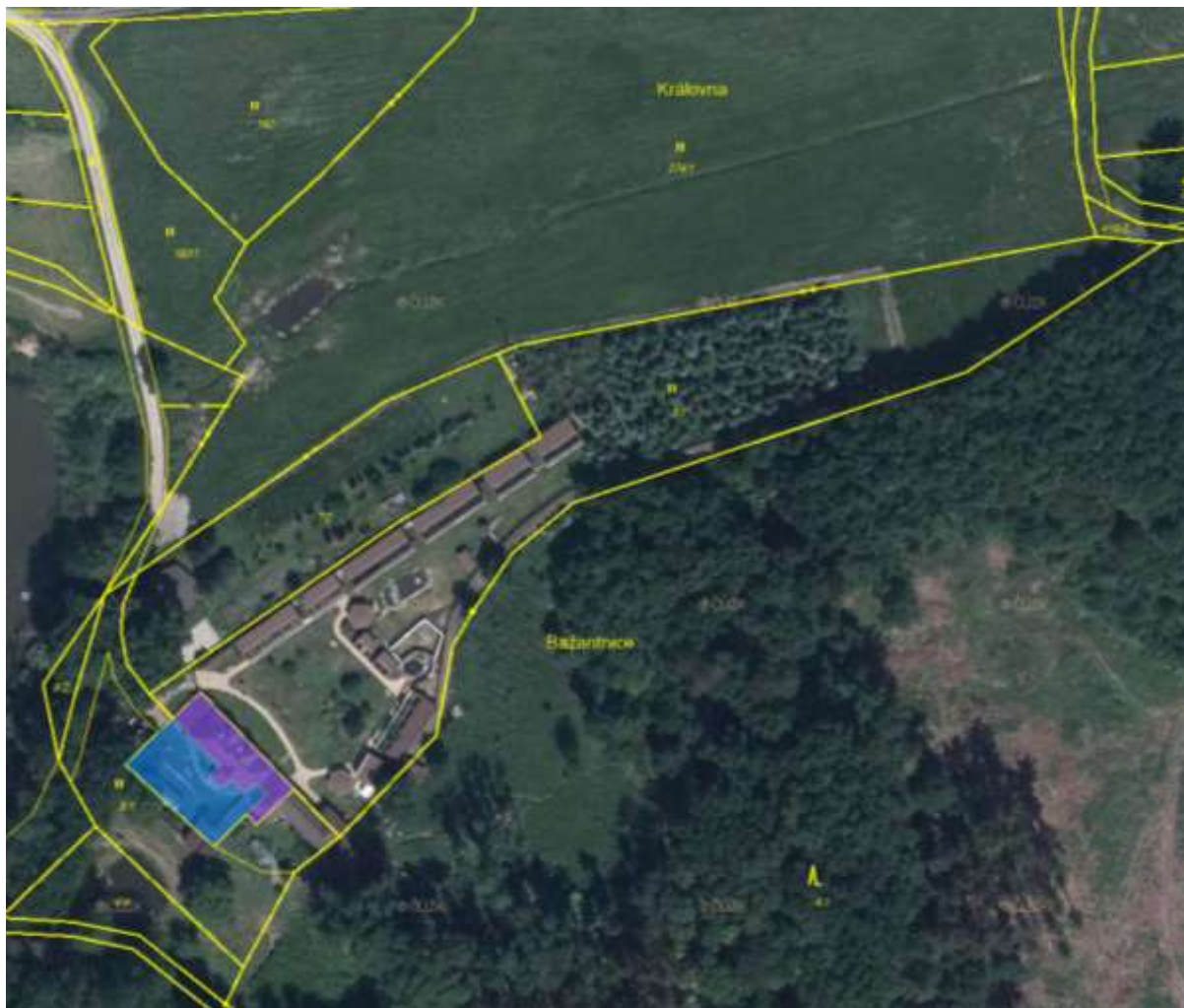
Obrázek 1: výřez z mapy KN vč. ortofotomapy dokládající antropogenní využití p.p.č. 7/1 a 7/2 v k.ú. Nová Ves u Čížové